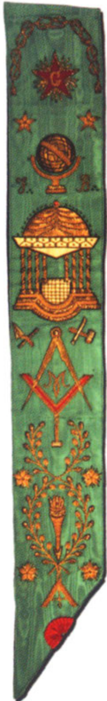
Старинный масонский кордон

Масонство очень быстро распространилось в Европе. В действительности оно соответствовало эволюции и ожиданиям гражданского общества того времени. В 1725 г. оно появилось во Франции. Им заинтересовались различные общественные классы: знать, духовенство, военные, художники, коммерсанты, артисты... В 1773 г. была создана Великая Ложа, которая получила название Великий Восток Франции. На протяжении всего XVIII в. Ложи продвигали в обществе идеи Просвещения. Они представляли собой модели общества, в которых практиковалась демократия и равенство. После Революции французское масонство попало под управление Наполеона I-го. Оно вернуло себе независимость только в последней четверти XIX в. При этом оно по-прежнему разделяло республиканские идеалы: Свободу, Равенство и Братство, и сыграло важную роль в становлении юной Республики. Фактически разрушенное во время второй мировой войны, масонство родилось заново. Сегодня во Франции насчитывается более 160 000 масонов и франкмасонство вновь стало лабораторией идей на службе Человечества.