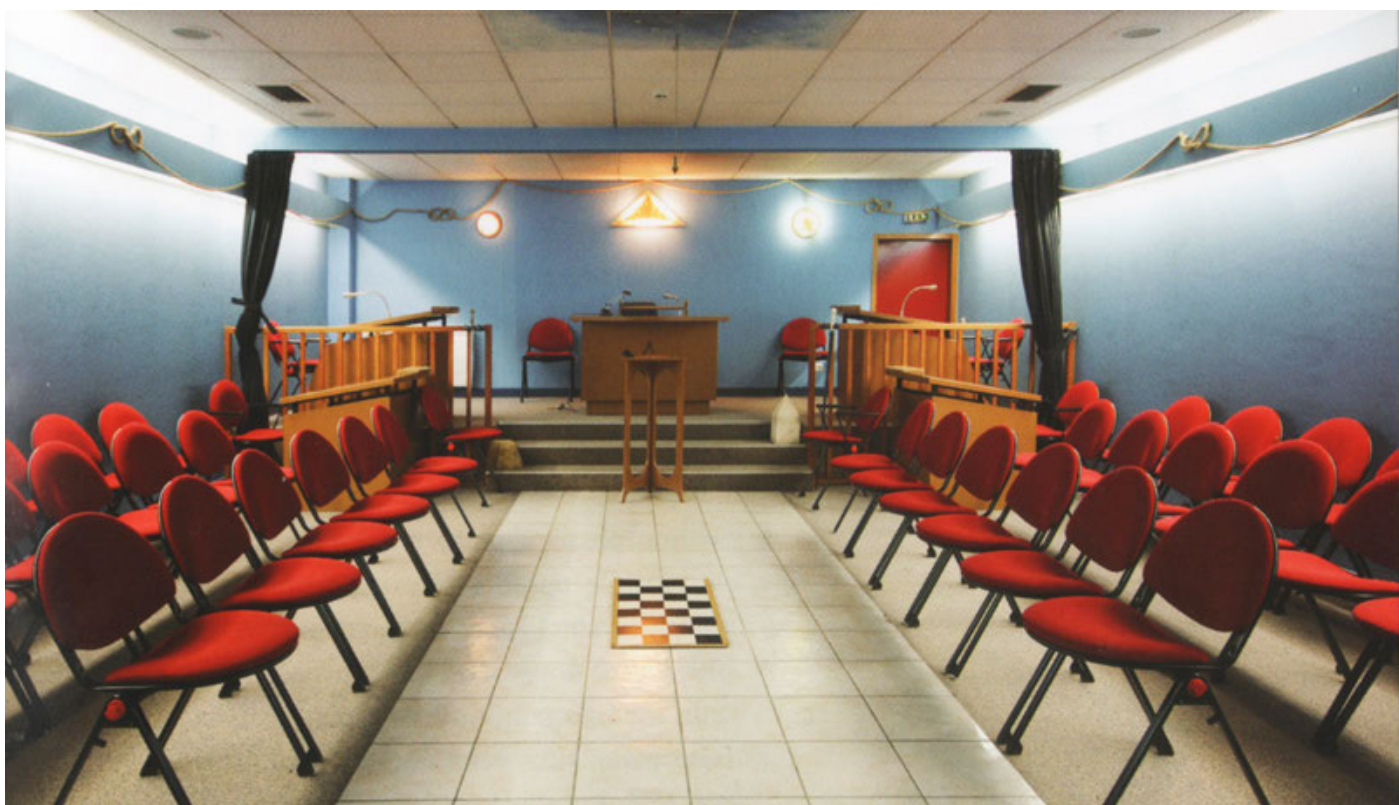
Один из Храмов Ордена в Париже

Стать масоном значит принять добровольное обязательство. Оно состоит в уважении определенных аспектов: солидарности и братства между Братьями и Сестрами; запрет на раскрытие кому бы то ни было принадлежность к масонству других лиц; постоянное присутствие, поскольку прогресс для масона невозможен без присутствия на Работах; уважение масонской дисциплины. Связанная с Ритуалом, эта дисциплина, тем не менее, основана на согласии; не затрагивая свободу каждого отдельного масона, она обеспечивает толерантное и братское слушание, свободу слова, качество работы.