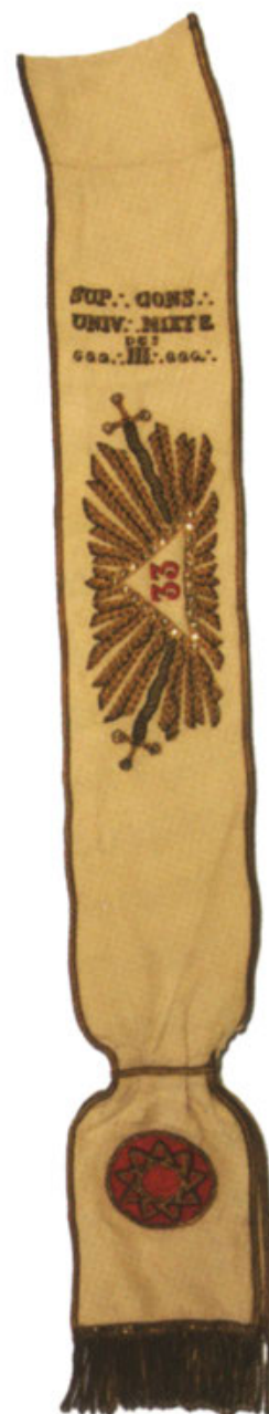
Старинный кордон члена Универсального Смешанного Верховного Совета

Провозглашая универсальность равенства мужчины и женщины, Орден «Право Человека» должен был стать международным. Он стал таковым в 1920 г. На сегодняшний день Орден насчитывает примерно 30 000 членов в 61 стране на всех континентах. Он организован в форме Федераций и Юрисдикций и управляется Международной конституцией. Его Верховный Совет состоит из Братьев и Сестер, живущих в разных странах. Каждые пять лет «Право Человека» проводит в Париже генеральную ассамблею, известную как Международный Конвент. Делегаты из 61 страны встречаются, чтобы обсудить свои идеи, свою работу и потрудиться во имя мира между нациями.