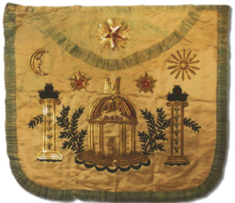
Старинный масонский запон

Ритуалы зашифровали в себе индивидуальное и коллективное поведение в Ложе. Они открывают новое пространство, удаленное от повседневного мира. Это единство действий, жестов, знаков, слов, вопросов и ответов, фраз... Ритуалы также создают условия для работы в Ложе с возможностью внимательно выслушать другого, со свободой слова, братством, развитием и прогрессом для каждого.