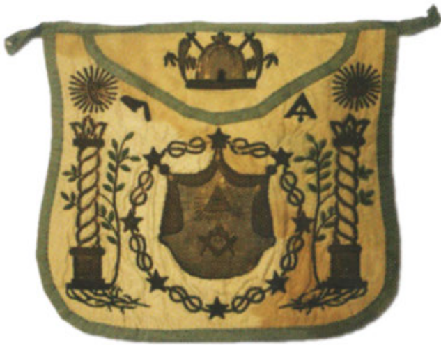
Старинный масонский запон

На их взгляд, вступление женщин в масонство было не только их правом, но и социальной и исторической необходимостью.